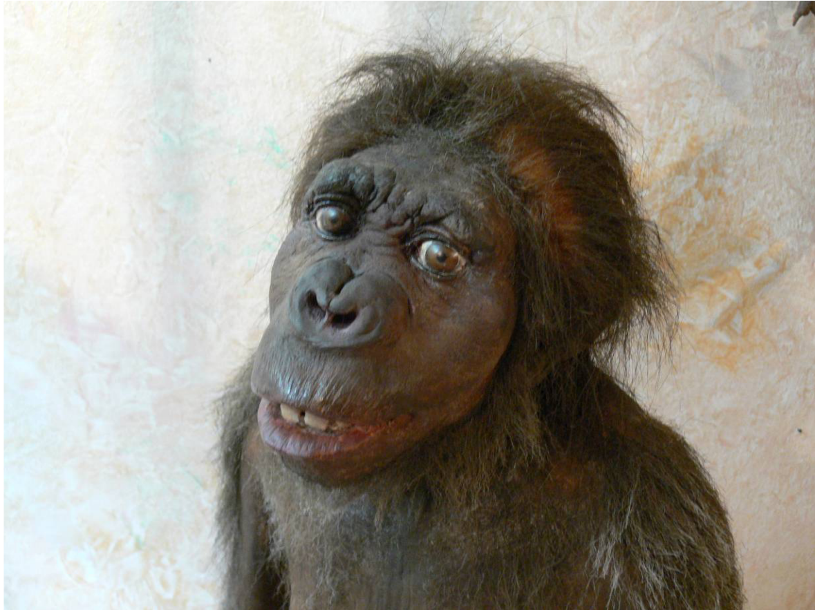
Bildtext: Eine unserer berühmtesten Vorfahren – Urmutter „Lucy“ lebte vor über 3 Millionen Jahren.

Außerdem hat der Osterhase versprochen auch im Natureum vorbei zu hoppeln. Ab 10 Uhr können sich alle Kinder am Ostersonntag und Ostermontag auf dem Spielplatz auf die Suche nach den bunten Eiern begeben. Groß und Klein können sich beim Bernstein schleifen am Ostersonntag von 13 – 16 Uhr selbst ein besonderes Ostergeschenk machen. Unter fachkundiger Anleitung entsteht aus einem unscheinbaren Rohling ein individuelles Schmuckstück, das z. B. als Kettenanhänger getragen werden kann.