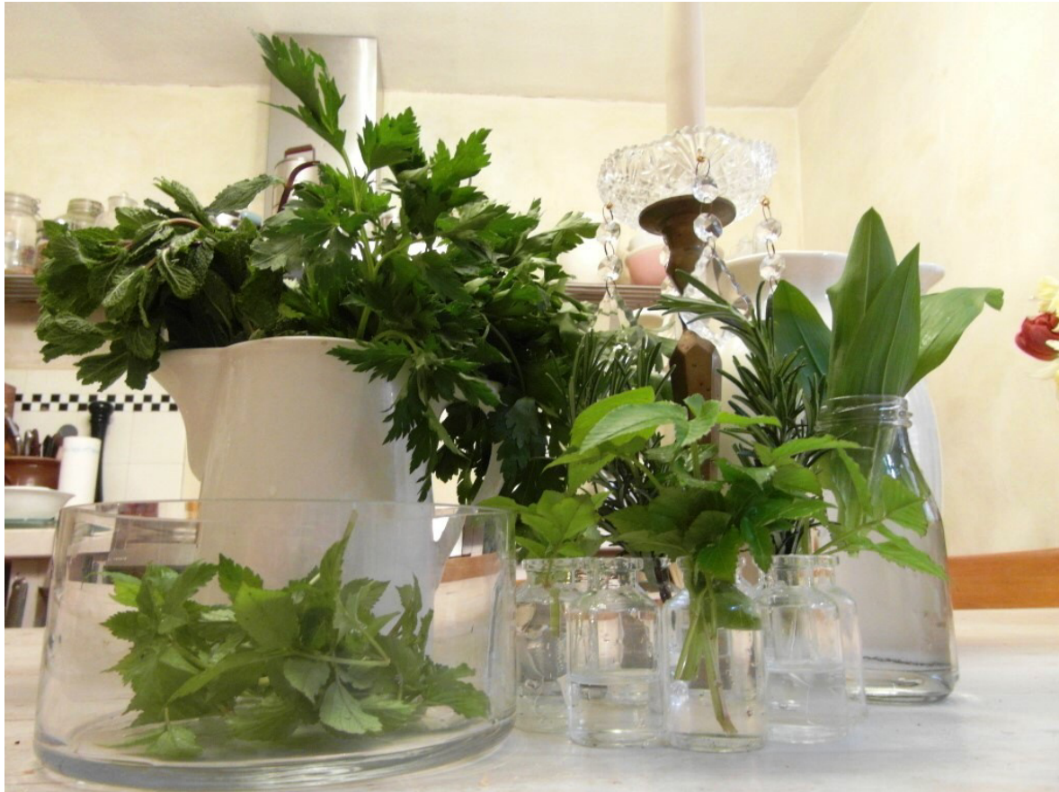
Bildtext: Von wegen Unkraut – aus dem Gärtnerschreck lässt sich Leckeres zaubern.